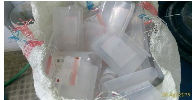
Efisiensi plabot bekas untuk di recycle