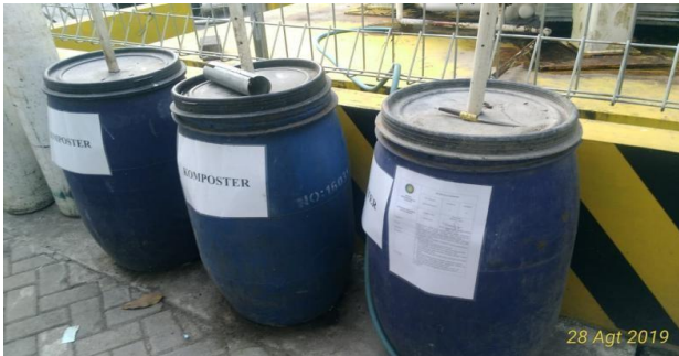
Pemanfaatan sisa makanan gizi